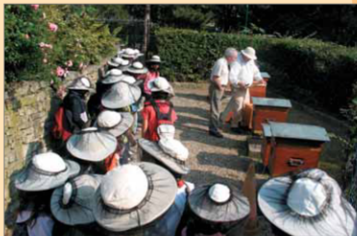
Rucher pédagogique du Parc Georges Brassens (Paris 15 e )